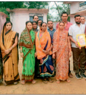
करने के उद्देश्य से भाजपा सरकार द्वारा एक पेड़ मां के नाम के तहत एक अभियान चलाया जा रहा है। जिसमें भाजपा मंडल केदुवां के कार्यकर्ता इस अभियान के तहत एक पेड़ मां के नाम पर पौधारोपण कर उसे