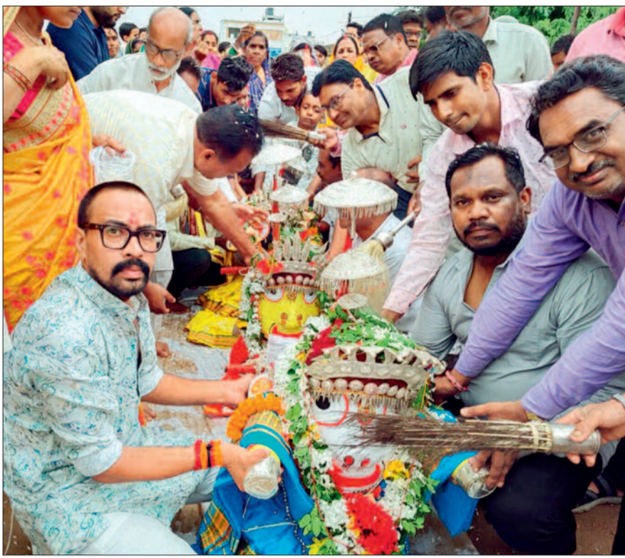
पिथौरा (ग्रामीण)। रथयात्रा पर्व बहुड़ा रथ (फिरती रथ) धूमधाम से हुआ। 9 दिन पहले अपने मौसी के घर गए भगवान जगन्नाथ, बलभद्र व माता सुभद्रा वापस जगन्नाथ मंदिर में विराजमान हुए। इस बहुड़ा रथ में जोरदार बारिश के बावजूद नगरवासियों ने बड़े ही श्रद्धा के साथ भगवान के दर्शन किए। जय जगन्नाथ के जयकारे लगाते हुए श्रद्धालुओं ने आगवानी की। इस दौरान आयोजक समिति के साथ बड़ी संख्या में नगरवासी उपस्थित रहे।