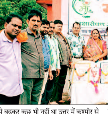
से बढ़कर कुछ भी नहीं था उत्तर में कश्मीर से लेकर पूर्व में बंगाल तक उन्होंने देश की एक-एक इंच भूमि के लिए संघर्ष किया और जम्मू-कश्मीर से दो प्रधान, दो विधान, दो निशान समाप्त करने के लिए शहीद तक हो गए जनसंघ की स्थापना से उन्होंने एक ऐसा राजनीतिक विकल्प दिया। जिसके मूल में भारतीयता थी। महान विचारक हम सब के

हरिभूमि न्यूज ►► बसना भाजपा मंडल भंवरपुर द्वारा ग्राम उड़ेला में भारतीय जनसंघ के संस्थापक वरिष्ठ नेता और भारत की एकता व अखंडता के प्रबल समर्थक डा. श्यामा प्रसाद मुखर्जी की जन्म जयंती मनाई गई। इस अवसर पर प्राथमिक कृषि साख सहकारी मर्या. उड़ेला धान खरीदी केंद्र में एक पेड़ मां के नाम से उपस्थित सभी भारतीय जनता पार्टी के कार्यकर्ताओं एवं सोसाइटी कर्मचारियों एवं आम नागरिक द्वारा फल दार, छायादार एवं फूलदार पौधों का रोपण किया गया।