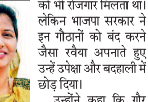
करने वाली बात यह है कि भाजपा गौ माता के नाम पर राजनीति तो करती है, लेकिन जब सेवा की बात आती है तो वही गौ माताएं सड़कों पर बेसहारा घूम रही हैं। भाजपा, जो गौ संरक्षण के नाम पर भावनात्मक राजनीति करती रही है, वही अब उनकी देखभाल तक सुनिश्चित नहीं कर पा रही है।

ने कहा कि गौठानों की उपेक्षा ने भाजपा सरकार की नाकामी उजागर कर दी है, केवल 19 माह में अक्षयवस्था दिखने लगी है। उन्होंने कहा कि छत्तीसगढ़ में भाजपा सरकार को सत्ता संधाले 19 माह बीत चुके हैं, लेकिन इन 19 महीनों में प्रदेश ने विकास की दिशा में प्रगति से अधिक गिरावट का अनुभव किया है। भूपेश बघेल के नेतृत्व वाली सरकार द्वारा शुरू की गई नरवा, गववा, घुरवा, बारी योजना का महत्वपूर्ण हिस्सा गौठान योजना, जिसे ग्रामीण अर्थव्यवस्था और पशुधन संरक्षण का आधार स्तंभ कहा गया था, आज भाजपा सरकार की बेरुखी के कारण बर्बादी